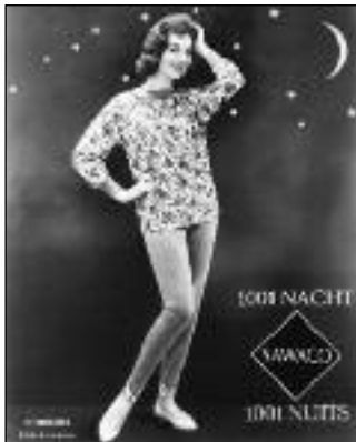
Mode für die Hausfrau? Pyjama-Werbung, um 1970

Sawaco ein und schuf so in der Branche neue Standards. Erschien die Firma Achtnich um 1960 als Unternehmen mit bunt-biederer Produktionspalette, so präsentierte sich das Erscheinungsbild um 1980 topmodisch. Aus einem Kleidergeschäft, das von Wolleanzügen über Bademode bis zu Unterwäsche ganz unterschiedliche Sortimente herstellte, entstand nach dem Bezug des Neubaus in der Grüze 1969 ein rationeller Betrieb, der in der Zeit der Wirtschaftskrise sein Heil in Spezialisierung, technischer Innovation und bester Qualität suchte. In Zusammenarbeit mit Modeschöpferinnen entstanden auf Messen hin ausgeklügelte Kleidersets; kunstvolle Prospekte und TV-Werbung machten auf die Neuerungen aufmerksam, und dank der Verwendung