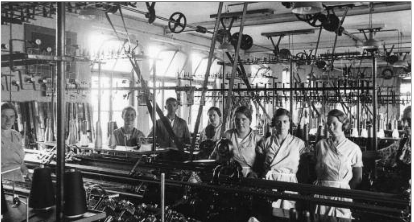
Strickereisaal mit Transmissionen, um 1935

Gross geworden durch «gestrickte Schweizer Unterkleider», die vor allem nach England und Amerika exportiert wurden, steht die Soci t  Anonyme Walter Achtnich & Co (Sawaco) f r viele kleinere und mittlere Betriebe, die im Schatten der weltbekannten Unternehmen zur industriellen Bl te von Winterthur – und der Schweiz – beigetragen haben. Praktisch ein Jahrhundert lang geh rte die Tricoterie der Familie Achtnich; die Fabrik- ist deshalb auch Familiengeschichte. Eine Sonderausstellung im Museum Lindengut in Winterthur dokumentiert das Schicksal einer Strickerei, die 1885/86 gegr ndet und 1990 geschlossen wurde.