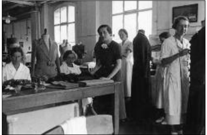
Die Abteilung «Kreation» an der Arbeit, um 1935

Das Schicksal der Strickerei Achtnich widerspiegelt die Geschichte der Unterwäsche, deren Stellenwert sich in den letzten Jahrzehnten einschneidend veränderte. Lange ein Kleidungsstück, das zwar aus hygienischer Sicht wichtig war, aber kaum wirklich geschätzt wurde, wandelte sich die Unterwäsche ab den 1970er Jahren rasch zu einer «zweiten Haut», die individuell, modisch und farbig sein durfte und immer stärker auch gegen aussen gezeigt wurde. Statt Tabu-Zone ein modisches, körperbetontes Accessoire – genau hier setzte die Produktion der