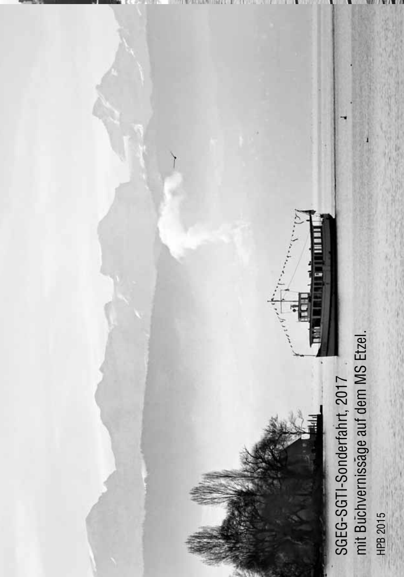
SGEG-SGTI-Sonderfahrt, 2017 mit Büchvernissage auf dem MS Etzel.