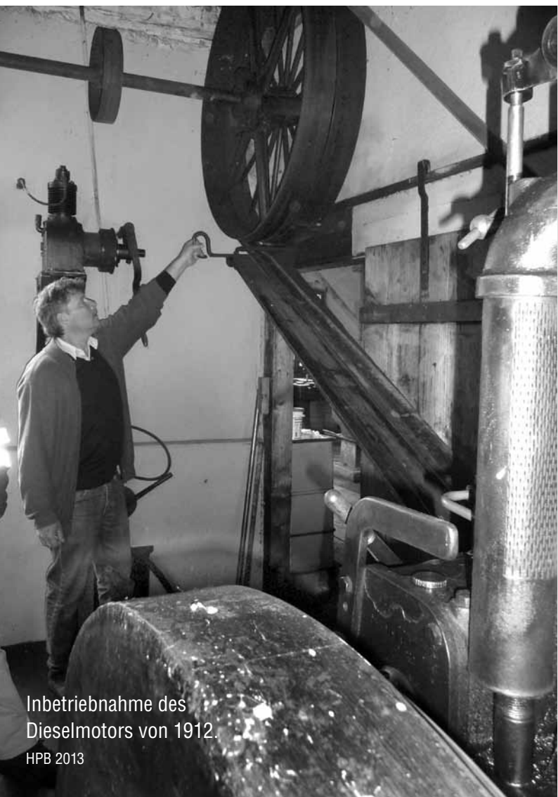
Inbetriebnahme des Dieselmotors von 1912.

Arias-Industriekultur Lindstrasse 35 8400 Winterthur