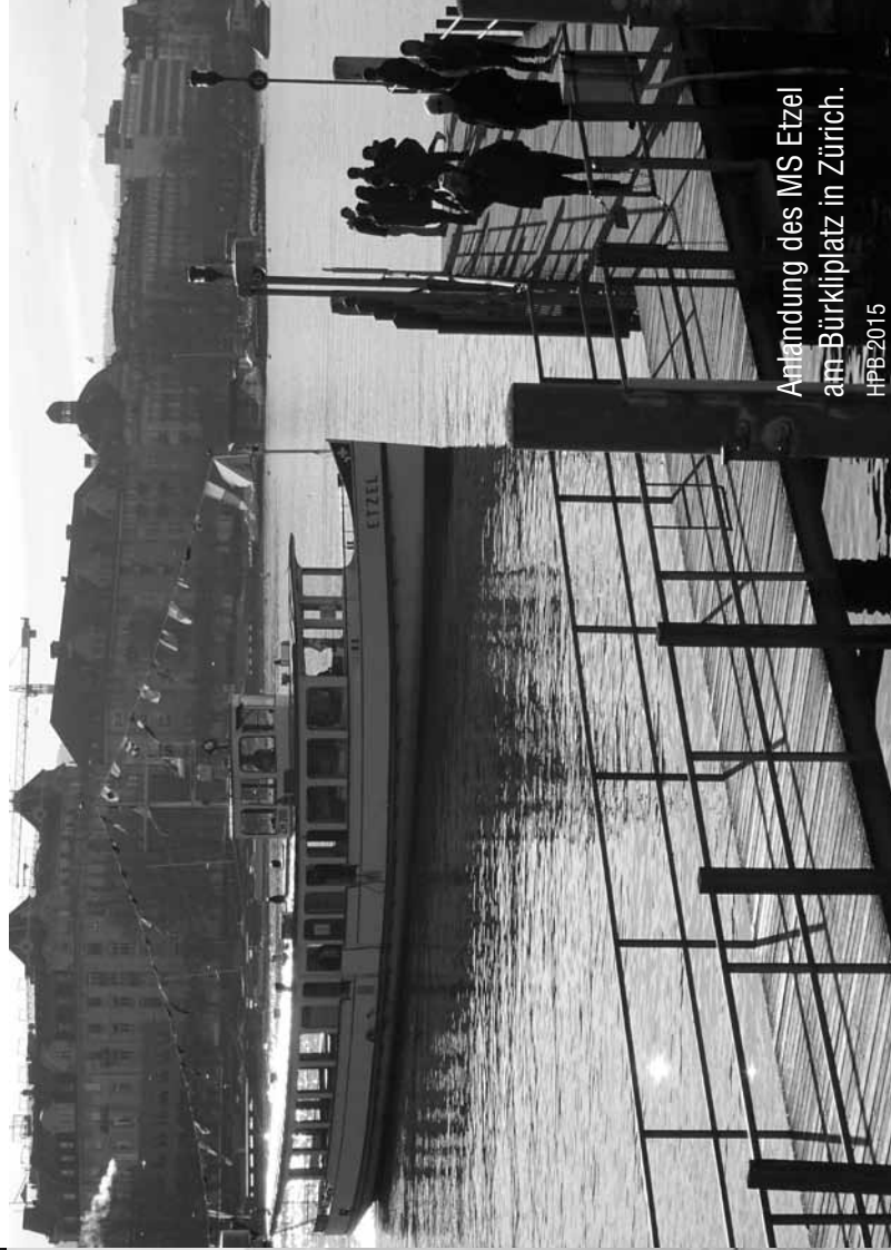
Anlandung des MS Etzel am Bürkliplatz in Zürich.