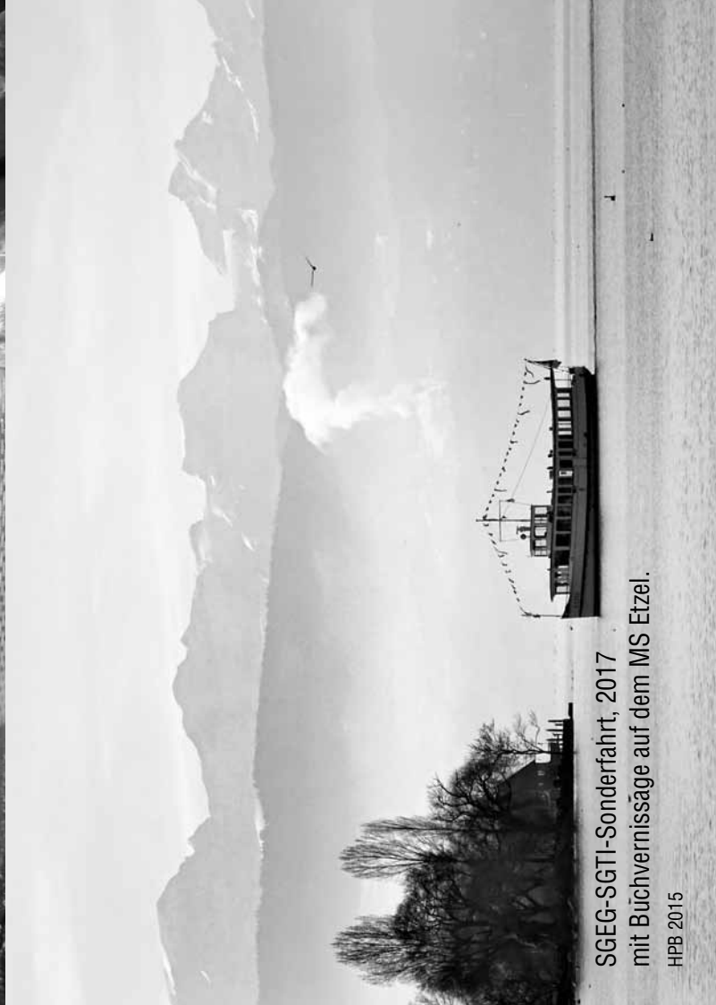
SGEG-SGTI-Sonderfahrt, 2017 mit Büchvernissage auf dem MS Etzel.