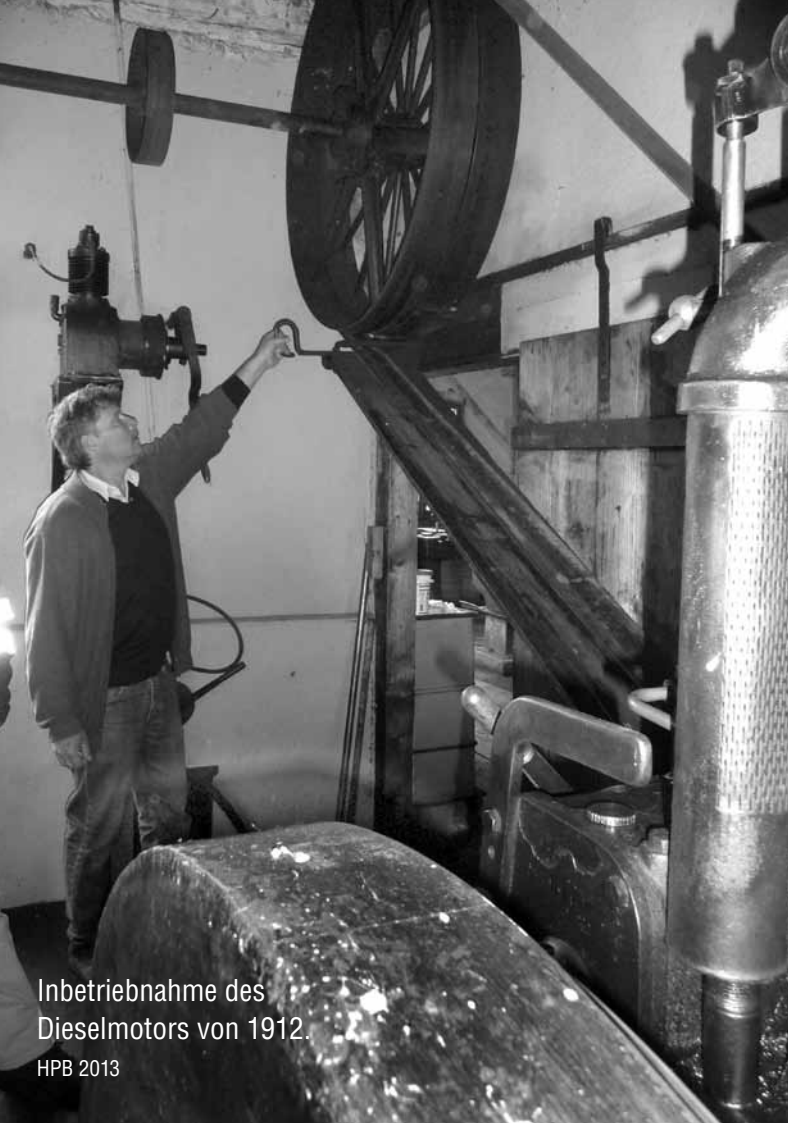
Inbetriebnahme des Dieselmotors von 1912.

Arias-Industriekultur Lindstrasse 35 8400 Winterthur